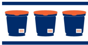
GTIN des Multi-Pack mit 3 Gläsern