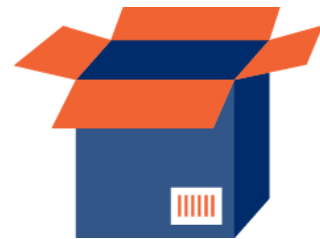
GTIN des Case mit 6 x Multi-Pack mit je 3 Gläsern

Die verschiedenen Artikelebenen aus einer Gesamthierarchie aus GDSN, welche als Consumer Unit markiert sind, werden in trustbox übernommen, wenn zusätzlich zu den trustbox-Pflichtinformationen, folgende Informationen übermittelt werden: